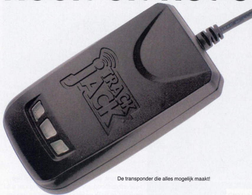
De transponder die alles mogelijk maakt!