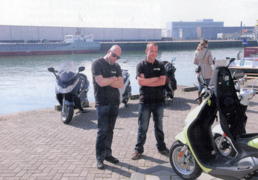
Dat is natuurlijk dubbelop, bewaking en Yamaha Neo's met Trackjack